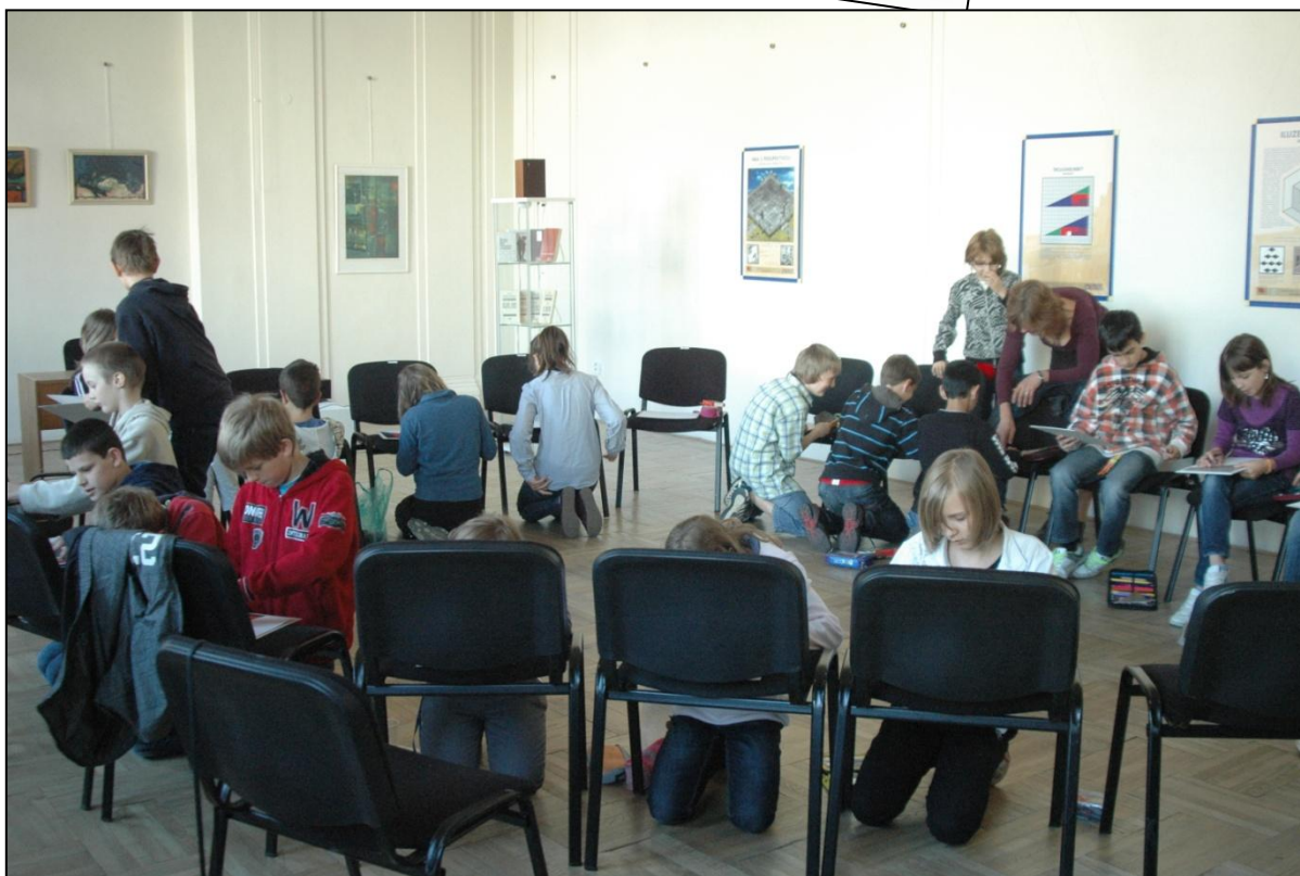
Některé z výstav Muzea umění a designu, jak je dnes dobrým zvykem, mapují vztah mezi uměním a vědou.