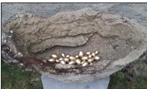
Stálá expozice plastiky: Co oči nevidí, rozum domyslí... (moderní a současné umění)