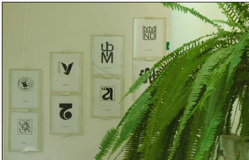
Pohled do stálé expozice českých grafických symbolů, logotypů a značek