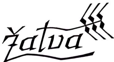
Zdeněk Sklenář, logotyp edice Žatva, 1975