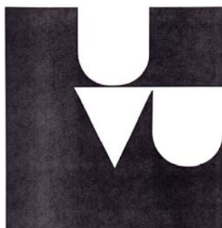
Rostislav Vaněk, značka Unie výtvarných umělců, 1991