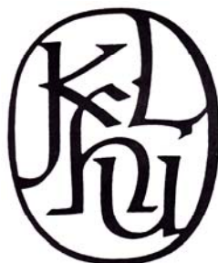
Oldřich Menhart, značka Nakladatelství krásné literatury, hudby a umění, počátek 50. let 20. století